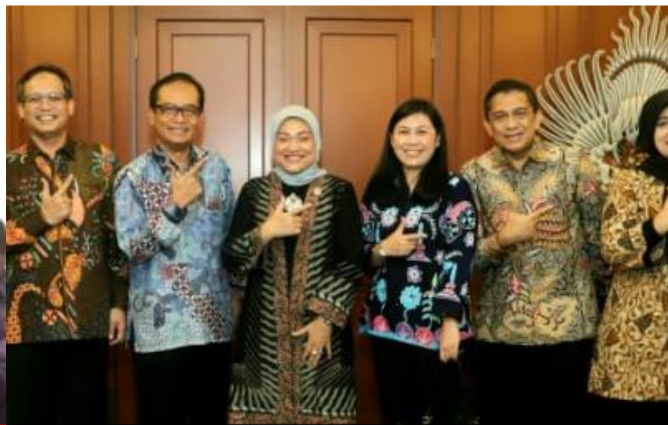
AUDIENSI BERSAMA MENTERI TENAGA KERJA