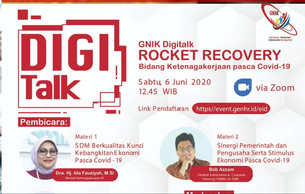
DIGITALK 11 REGULAR SESSION & 1 EXCLUSIVE SESSION DENGAN RATA-RATA 100-200 PESERTA / SESSION