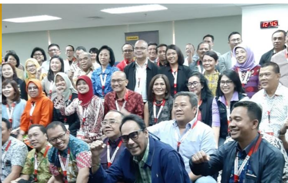
CRASH PROGRAM HR MANAGER CERTIFICATION