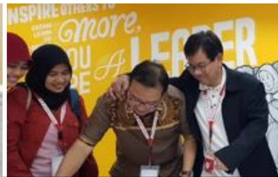
PENANDATANGANAN HR DIRECTOR COMMITMENT UNTUK INDONESIA KOMPETEN