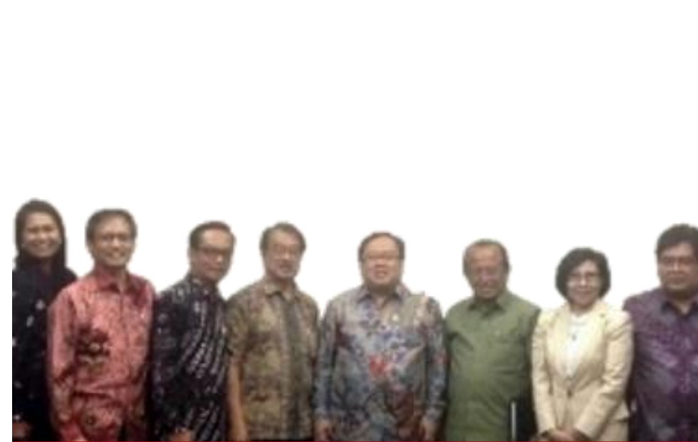
AUDIENSI BERSAMA MENTERI PPN/BAPPENAS