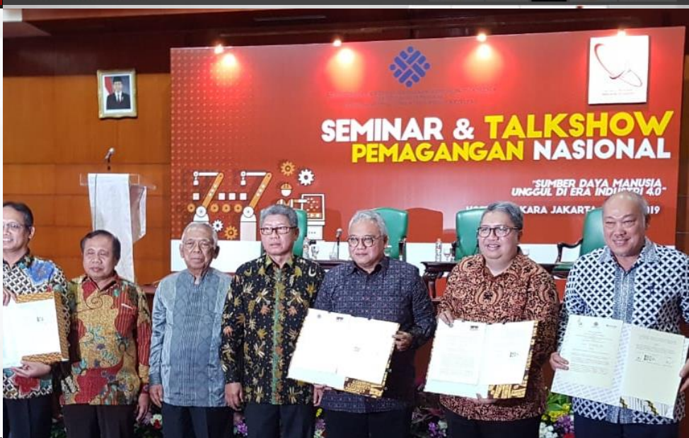
MOU DENGAN KEMNAKER, BPJS, BNSP, & APRINDO