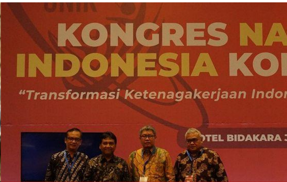
KONGRES NASIONAL INDONESIA KOMPETEN