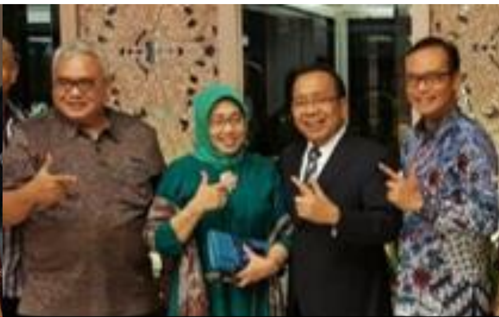
AUDIENSI BERSAMA MENSESNEG