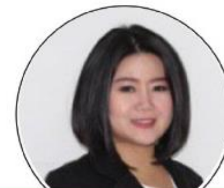
Kartika Chief of Organizational Excellence GML Performance Consulting