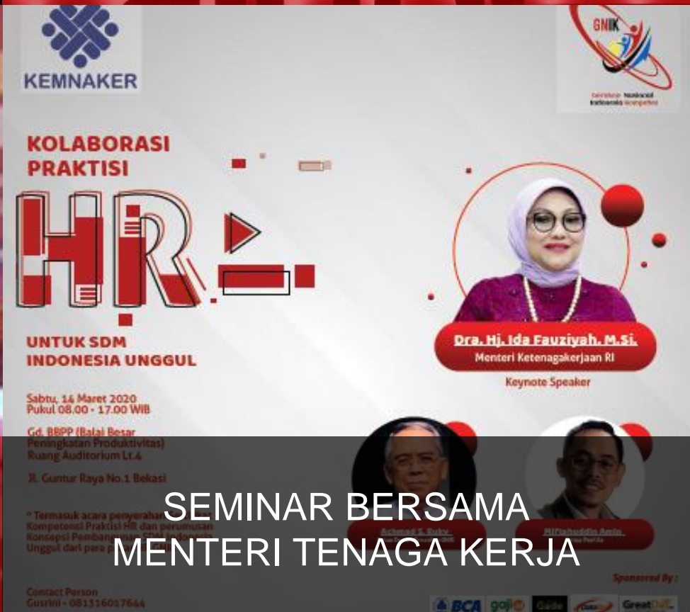
SEMINAR BERSAMA MENTERI TENAGA KERJA