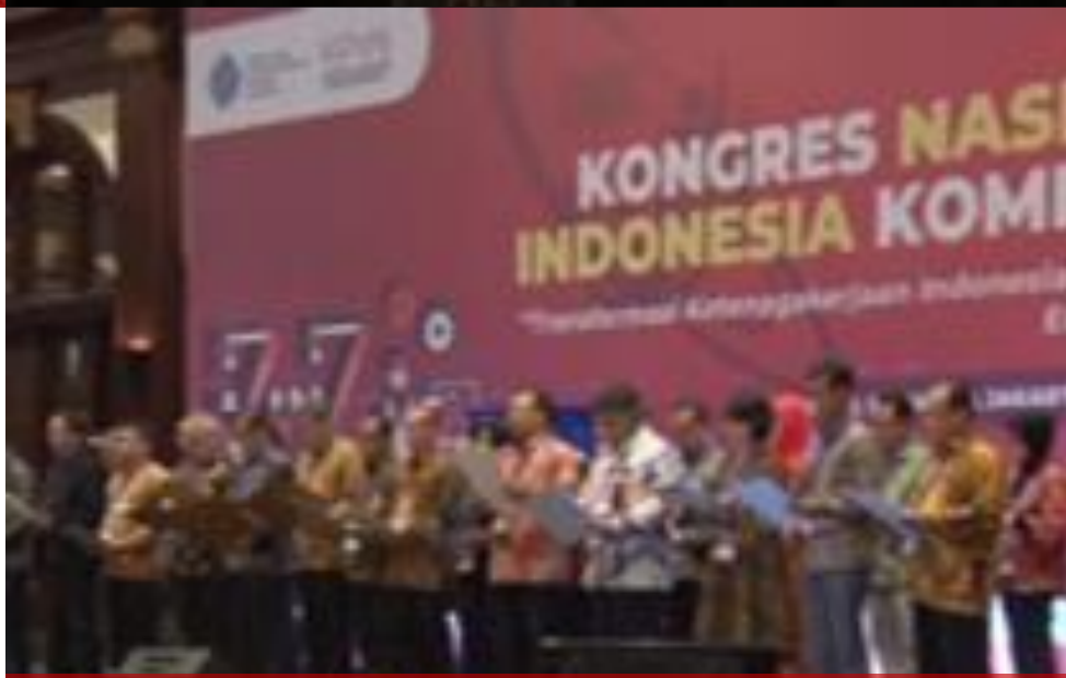
APPOINTMENT OF DIREKTUR AREA GNIK

Anggota dan Relawan GNIK di Seluruh Indonesia Bekerja Sama untuk Mewujudkan SDM Indonesia Kompeten.