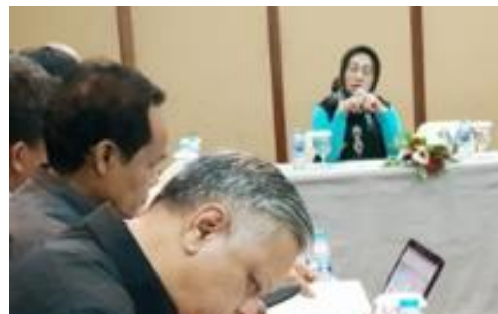
AUDIENSI DENGAN KEMENRISTEKDIKT