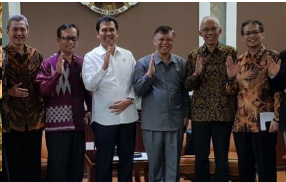
AUDIENSI BERSAMA MENTERI PAN RB